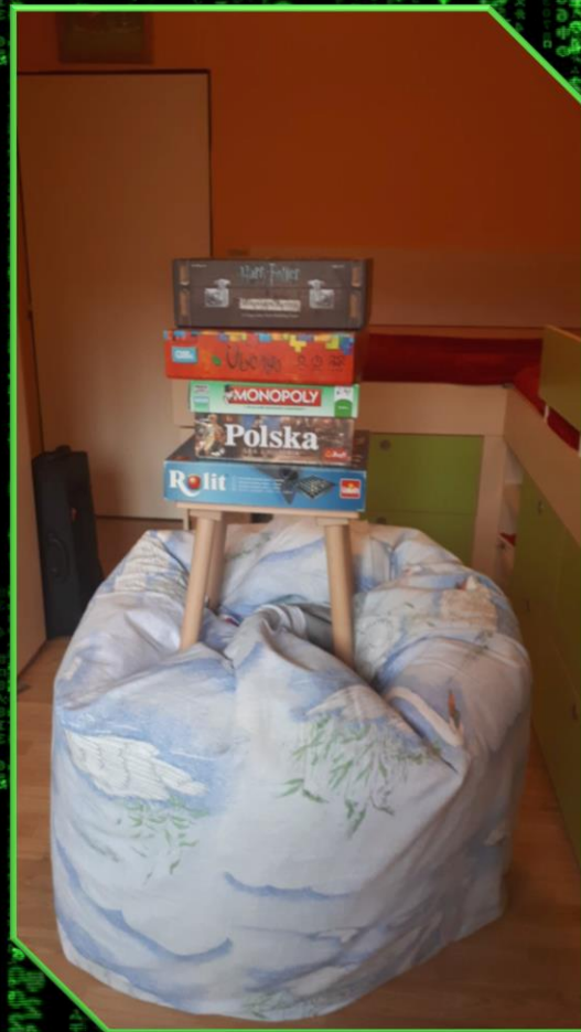
Każdy radził sobie jak umiał – statwy na różne sposoby.

Wiedzieliśmy też, że nauczanie zdalne i dzieci w domu przez cały dzień nie są łatwą sprawą dla rodziców i nie chcieliśmy im naszą działalnością jeszcze bardziej komplikować sprawy.